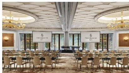
FOUR SEASONS - Hôtel SPA - Calle de Sevilla, 3, 28014 MADRID

Inscription, informations et paiement en ligne : www.ceto-europe.com – Cliquer sur Formation Continue - Accès membre - contact@ceto-europe.com